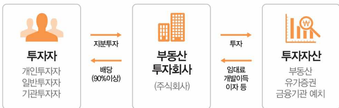
[ 리츠의 기본구조 ]

* 리츠란? 주식회사의 형태로 다수의 투자자로부터 자금을 모아 부동산에 투자하고 수익을 돌려주는 부동산간접투자기구(Real Estate Investment Trusts)